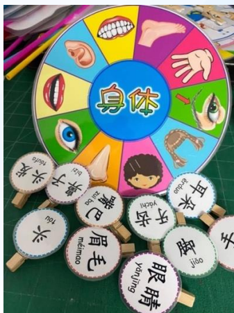
รูปที่ 11 เกมวงล้อ ที่ใช้เทคโนโลยีออกแบบภาพและใส่คำศัพท์เสร็จแล้วนำมาตัดแปะ ตกแต่งให้สวยงาม