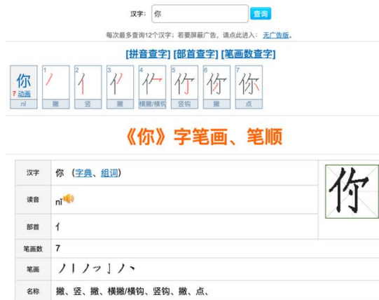
รูปที่ 5 เว็บไซต์ช่วยสำหรับการเรียนการสอนลำดับขีด ขั้นตอนการเขียนคำศัพท์ภาษาจีน

3) เว็บไซต์ช่วยเรื่องลำดับขีด เป็นตัวช่วยเรื่องการสอนลำดับขีดของคำ และในเว็บไซต์นี้ยังมีการแนะนำวิธีการเขียนคำศัพท์ เสียงอ่าน ลำดับขีด ชื่อของแต่ละขีด ความหมายของคำศัพท์ ยกตัวอย่างคำศัพท์ที่มาจากคำนั้น ๆ รวมถึงการตัวอย่างการแต่งประโยคอีกด้วย