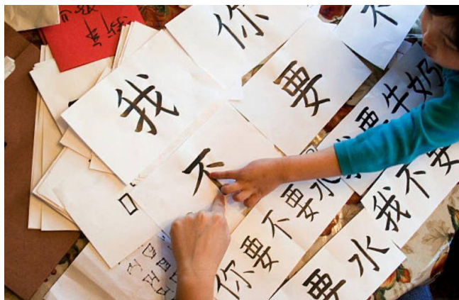
รูปที่ 1 บัตรคำศัพท์ทำมือ

สื่อประดิษฐ์ที่สามารถใช้ในระหว่างการจัดการเรียนการสอนในห้องเรียนหรือแบบออนไลน์ โดยสามารถกระทำได้เลยทันที ยกตัวอย่าง ได้แก่