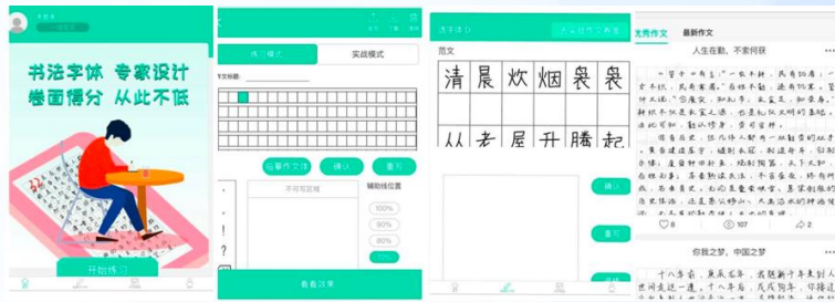
รูปที่ 4 แอปพลิเคชันการเขียนบทความออนไลน์