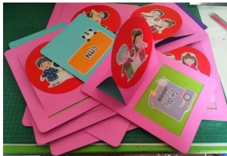
รูปที่ 10 ป๊อปอัพคำศัพท์ภาษาจีนจากการใช้เทคโนโลยีออกแบบ และตัดออกมาแปะกาว ตกแต่งให้สวยงาม

สื่อการสอนในรูปแบบสื่อประติมากรรมก็ยังคงมีความสำคัญ ควรค่าแก่การอนุรักษ์ไว้ ถึงแม้ว่าเทคโนโลยีจะเข้ามามีบทบาทแทนที่ แต่ผู้สอนยังคงสามารถใช้เทคโนโลยีผลิตสื่อประติมากรรม โดยการออกแบบผ่านโปรแกรม Power point โปรแกรม Word โปรแกรม Photoshop หรือจะเป็นแอปไอปิสพันท์ ที่ผู้เขียนได้กล่าวไว้ข้างต้นแล้ว เป็นต้น การใช้เทคโนโลยีออกแบบสื่อประติมากรรมจะทำให้สื่อการสอนนั้นมีความทันสมัย สวยงาม ทั้งยังสร้างมูลค่าได้อีกด้วย เช่น การสร้างบัตรคำศัพท์ภาษาจีนจากกระดาษ การสร้างเกมวงล้อคำศัพท์ภาษาจีนจากกระดาษ การสร้างเกมไม้หนีบจับคู่คำศัพท์ภาษาจีนจากกระดาษ การสร้างป๊อปอัพคำศัพท์หรือนิทานจากกระดาษ เป็นต้น ตัวอย่าง ดังนี้