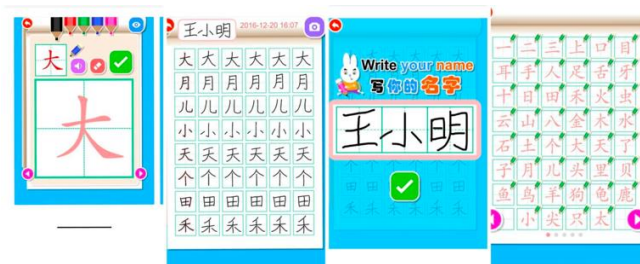
รูปที่ 3 แอปพลิเคชัน ฝึกเขียนตัวอักษรจีน

1) แอปพลิเคชัน พัฒนาทักษะด้านการเขียนตัวอักษรจีน และช่วยจำคำศัพท์ มีคำศัพท์จำนวนมากให้เลือกฝึกเขียนตามตัวอย่างได้ และที่พิเศษคือครูผู้สอนสามารถแจ้งคำศัพท์และมอบหมายเป็นการบ้านให้ฝึกเขียนได้อีกด้วย ผู้เรียนสามารถใช้นิ้วเขียนลงบนโทรศัพท์มือถือหรือแท็บเล็ตได้อย่างสะดวก เมื่อเขียนคำศัพท์เสร็จแล้วสามารถเขียนชื่อผู้เรียน และบันทึกภาพส่งให้กับผู้สอน ผู้สอนก็สามารถตรวจสอบวันและเวลาการทำการบ้านได้อีกด้วย