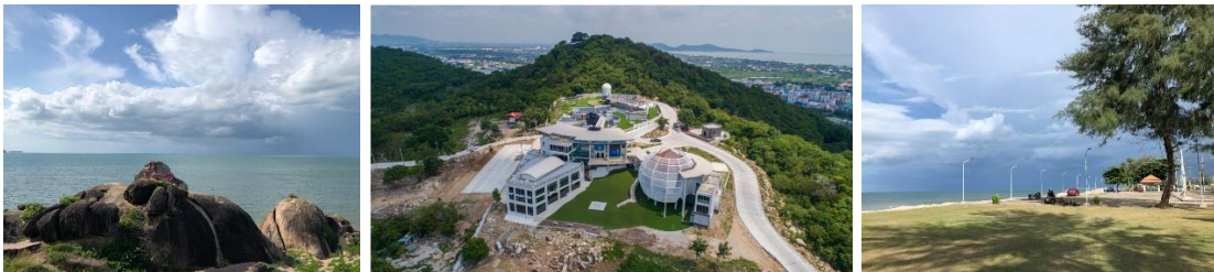
ภาพที่ 2 สภาพพื้นที่ทางภูมิศาสตร์ในเขตเทศบาลเมืองเขารูปช้าง

1.3 ด้านวิถีชีวิตและความเป็นอยู่ ตำบลเขารูปช้าง ตั้งอยู่ในตอนกลางของอำเภอเมืองสงขลา จังหวัดสงขลา มีลักษณะกึ่งชุมชนเมือง ประชากรส่วนใหญ่ประกอบอาชีพรับจ้าง รับราชการ ค้าขาย และเกษตรกรรม ลักษณะและสภาพความเป็นอยู่ในครอบครัวและชุมชนเขารูปช้าง ในอดีตจะอยู่กันแบบครอบครัวใหญ่ บ้านญาติพี่น้องอาศัยอยู่ใกล้กัน คนสมัยก่อนส่วนใหญ่ จะเป็นคนในพื้นที่เกือบทั้งหมด มีสภาพความเป็นอยู่แบบพหุมีพอกิน แต่เมื่อความเจริญเข้ามามากขึ้น ความเป็นเมืองจึงเข้ามาแทนที่ กิจกรรมทางสังคมส่วนใหญ่จะอยู่ในรูปของกิจกรรมทางประเพณีวัฒนธรรม ในอดีตชาวบ้านจะร่วมมือร่วมแรงร่วมใจกันมาช่วยงานเมื่อมีงานในชุมชน ทำกับข้าวกันเอง ดังข้อมูลที่ได้จากผู้ให้สัมภาษณ์ ดังนี้