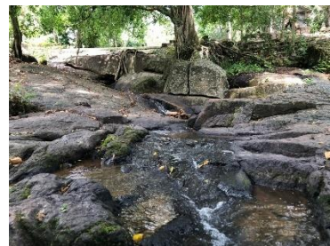
ภาพที่ 3 แหล่งท่องเที่ยวในเขตเทศบาลเมืองเขารูปช้าง