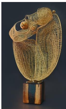
ภาพผลงาน

ผลงาน ปีที่สร้าง ขนาดผลงาน วัสดุ แนวความคิด