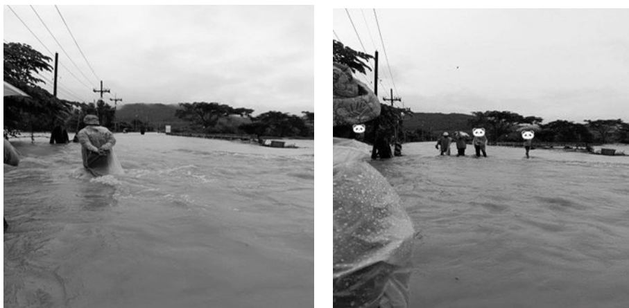
Figure 3 The flooding in suburban areas on 27–28 November 2024 (Hat Yai, Southern, Thailand)

อาจจะส่งผลให้เกิดภัยพิบัติหรือเกิดน้ำท่วมชุมชนเกษตรกรรมในพื้นที่ชนเมืองอำเภอหาดใหญ่ได้รับผลกระทบจากภัยพิบัตินี้ดังกล่าว ดังที่เกิดน้ำท่วมเมืองหาดใหญ่เมื่อกลางเดือนพฤศจิกายน 2567 (Figure 3)