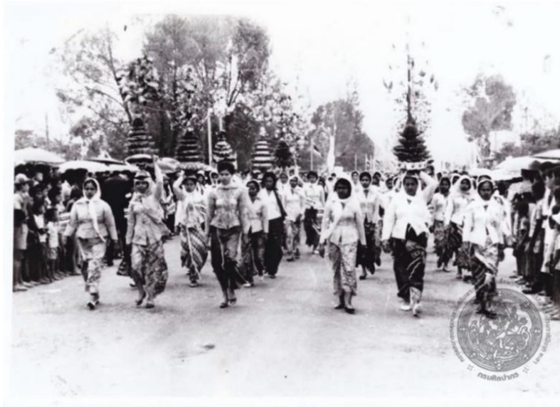
Figure 3 A Bunga Sire procession from Yala Province