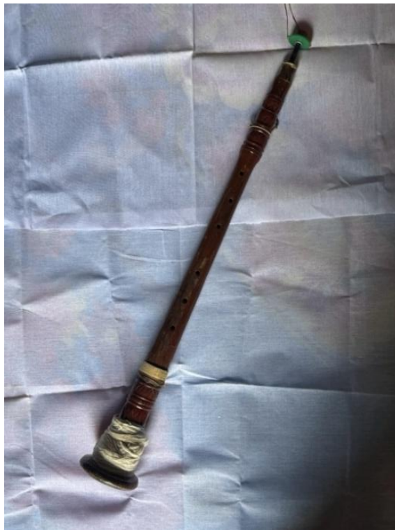
Figure 9 Pi-Suna from a musician in Narathiwat Province

1. ปี่ซุนา เครื่องเป่าประเภทปี่ลิ้นคู่ (Double Reed) แบบมีลำโพง เป็นเครื่องดนตรีที่พบได้ทั่วไปในวัฒนธรรม ดนตรีชาว-มลายู ลักษณะเดียวกับปี่ชวาในภาคกลาง นอกจากนั้นปี่ลักษณะเดียวกันนี้ยังปรากฏในวงดนตรีภาคใต้ชนิดอื่น เรียกชื่อต่างกันไปตามการประสมวง เช่น ปี่กาหลอหรือปี่ฮ้อในวงกาหลอ ปี่สละหรือปี่ตึกาในวงสละ โดยปี่ชนิดนี้ทั้งชาวและ มลายูกลางเรียก “สุรุโน” (Serunai) แต่สำเนียงปัตตานีจะเรียกเป็น “ซุนา” (Figure 9) ลักษณะของปี่ซุนาที่พบในภาคใต้ มลายู และชวา มีขนาดและรูปร่างใกล้เคียงกัน สามารถถอดแยกออกเป็นส่วน ๆ ได้ถึง 3 ส่วน ได้แก่ ส่วนที่ 1 ครอบปาก หรือเลาปี่ ส่วนที่ 2 กำพวดและลิ้นปี่ และส่วนที่ 3 ลำโพงปี่ ทำขึ้นใช้กันในภาคใต้ตอนล่าง ทั้งของชาวไทยพุทธและชาวไทย มุสลิมเชื้อสายมลายู มักทำขึ้นมาจากแก่นไม้ขนุนทั้งเลาปี่และลำโพงปี่