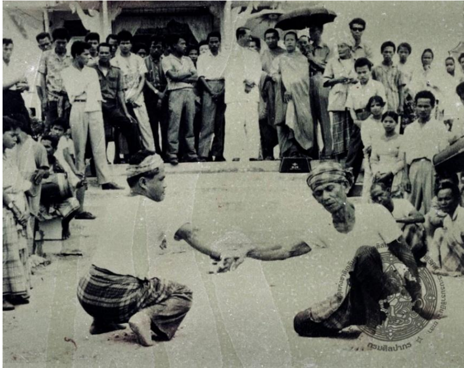
Figure 5 Silat from Yala Province