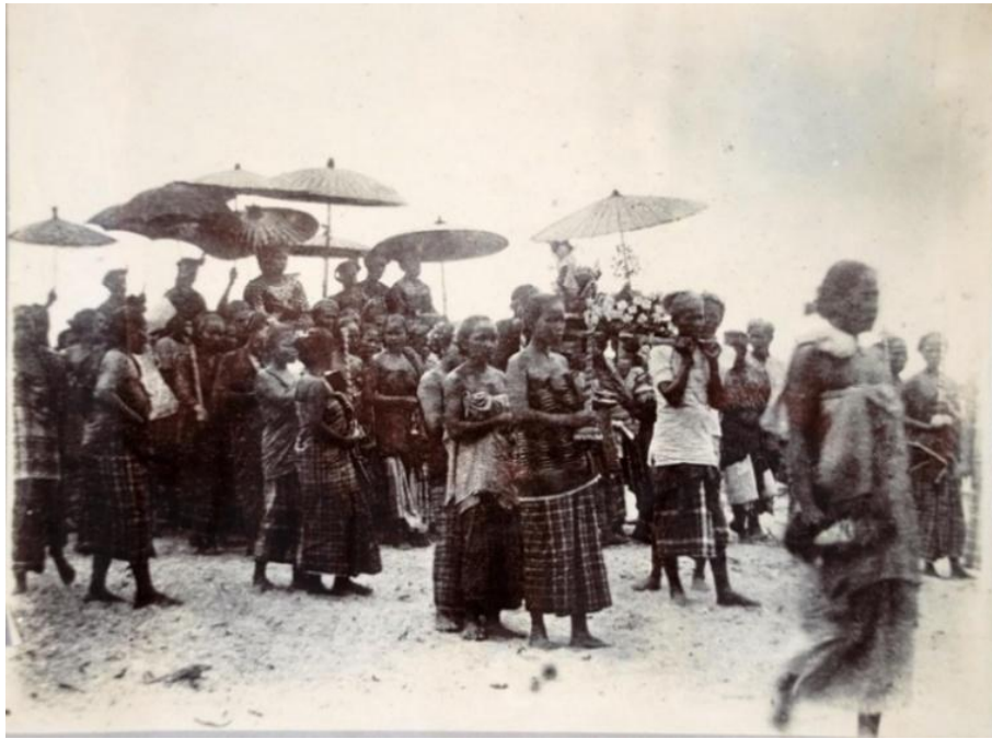
Figure 2 A noble procession in pre-circumcision procession from Pattani Province

Source: Museum of Archaeology and Anthropology, University of Cambridge 3