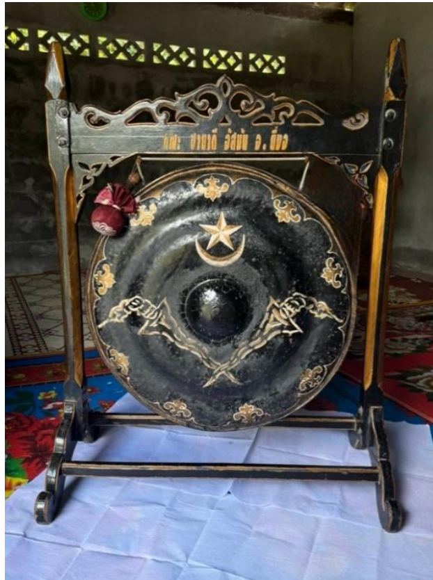
Figure 10 Gong from a musician in Narathiwat Province