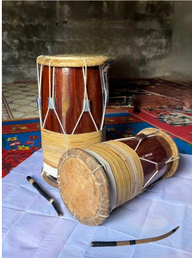
Figure 11 Gendang or Melayu Drums from a musician in Narathiwat Province