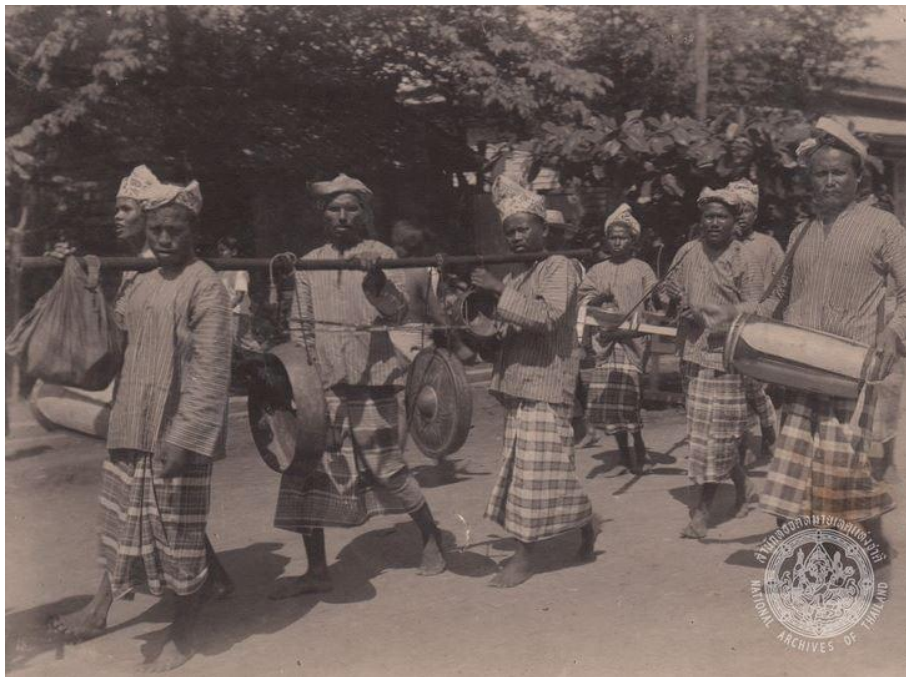
Figure 1 A musical procession from Pattani Province

ขบวนที่ 1 ดนตรี: ดนตรีที่ใช้ประกอบขบวนแห่มุสลิมในเขตจังหวัดชายแดนภาคใต้มีลักษณะของวงดนตรีประเภทวงปี่กลอง ประกอบด้วย ปี่ซุณา 1 เล้า ซ้องมลายูขนาดใหญ่โดยใช้คานหาม 1 หรือ 2 ใบ และกั๋งดั่งหรือกลองมลายู 1 คู่ วงดนตรีชนิดนี้เป็นวงลักษณะเดียวกับวงดนตรีประกอบการแสดงศิลปะ บรรเลงนำหน้าขบวนเพื่อส่งสัญญาณและประโคมให้เกิดเสียงดนตรีในขณะที่ขบวนกำลังดำเนินไป (Figure 1) นักดนตรีในขบวนแห่นี้ นิยมใช้เป็นผู้ชายทั้งหมด แต่งกายด้วยชุดพื้นเมือง นิยมสวมเสื้อและกางเกงขายาวนุ่งผ้าซอกแก้้ตักบักกางเกงหรือนุ่งโสร่งยาวลายตาราง และมีผ้าโพกศีรษะ