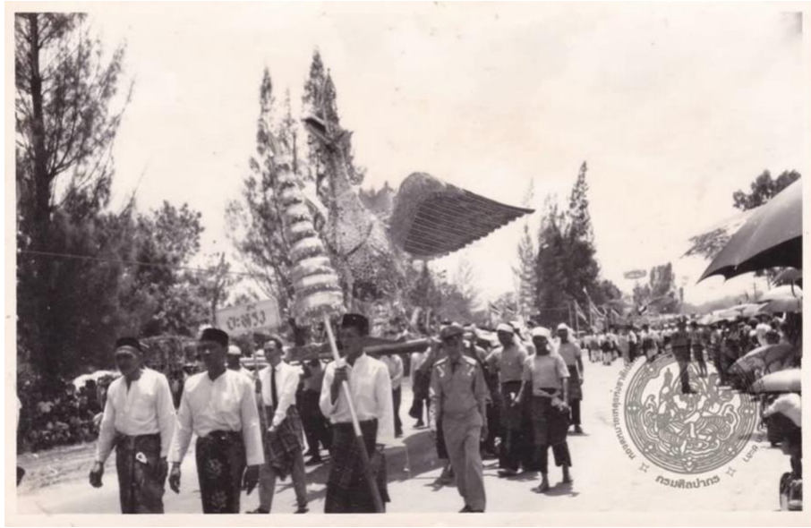
Figure 6 A bird carrying pole procession from Pattani Province