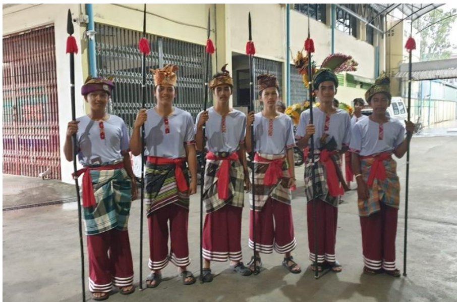
Figure 7 A spear and dagger procession

ขบวนที่ 6 ขบวนพลกริช พลหอก: ขบวนพลกริช พลหอก ทุกคนในขบวนแต่งกายอย่างนักรบชายสมัยโบราณ ถือหอกและกริช เดินตามหลังขบวนนก (Figure 7) ซึ่งต้องใช้คนมากจะทำให้ขบวนแห่นกน่าดูและน่าเกรงขามมากยิ่งขึ้น