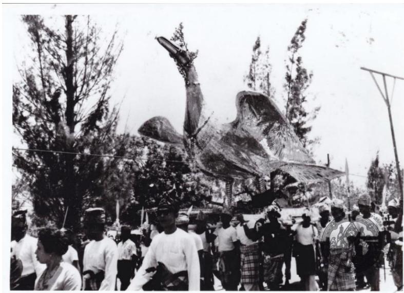
Figure 4 A Bird caretaker procession from Yala Province

ขบวนที่ 4 ผู้ดูแลนก: ผู้ดูแลนกเป็นผู้ที่ทำหน้าที่ที่มีนัยสำคัญลักษณะเดียวกับจัตุรัสคบาทหรือทหารประจำ เท้าข้างของแม่ทัพสมัยโบราณ ใช้ผู้ชาย 2 คน แต่งกายแบบนักรบมลายูโบราณ มือถืออาวุธกริชหรือหอกเดินนำหน้านก (Figure 4) คัดเลือกจากผู้ชำนาญการร้ายรำลีละ รำกริช และรำหอก อันเป็นศิลปะการต่อสู้อย่างหนึ่งของชาวไทยมุสลิม เมื่อขบวนแห่ไปถึงจุดหมายหรือที่อาศัยนักร้องอยู่ ผู้ดูแลนกจะใช้ศิลปะการร้ายรำให้แขกหรืออาศัยนักร้องอีกด้วย (Figure 5)